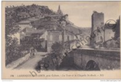
286 - ARRAS (Nord), France, view of the street, the tower of the church, and the bridge, c. 1910